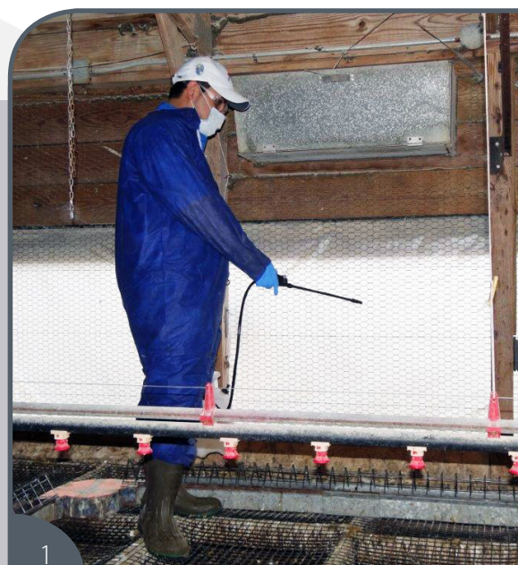
1 Aplicación de un insecticida residual de mayor duración.