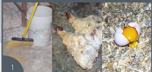
Retirar de la cama de la granja.