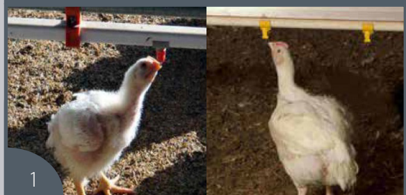
Cama seca y friable.