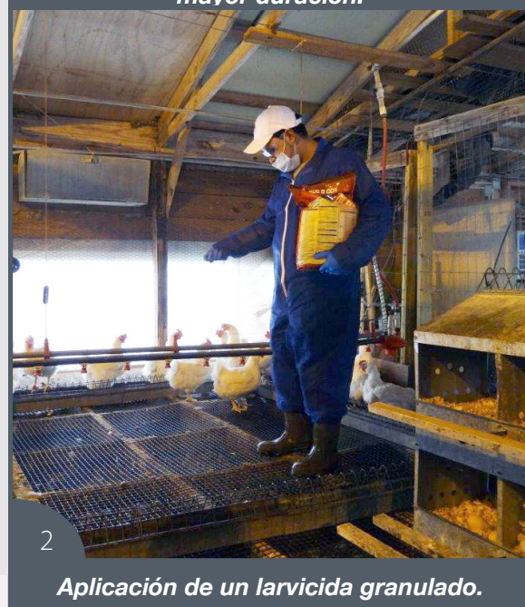
2 Aplicación de un larvicida granulado.