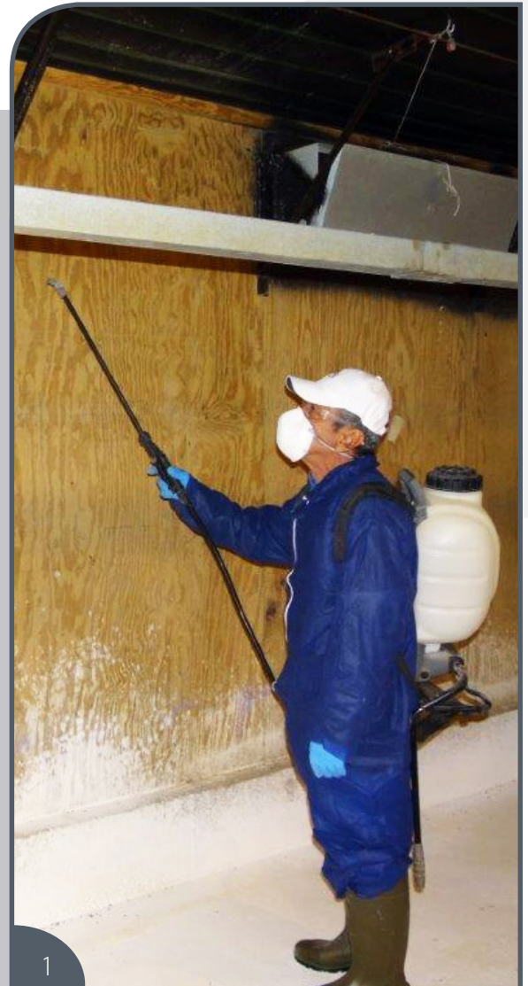
1 Aplicar el insecticida solo en naves vacías.